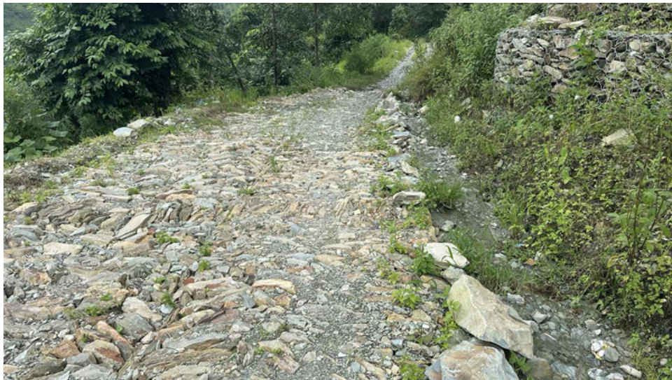
प्रहरी चौकी छेउ तथा यसमा मा.वि. मुनि सडक स्तरोन्नति (सोलिड) आयोजना

(ख) बीमा व्यवस्था : प्रधानमन्त्री रोजगार कार्यक्रम सञ्चालन निर्देशिकाको दफा ८७ मा यस कार्यक्रम अन्तर्गत श्रमिकलाई काममा खाटाउँदा रोजगार सेवा केन्द्रले दुर्घटना बीमा गरी खटाउनु पर्ने व्यवस्था छ । यसरी बीमा गर्दा लाग्ने खर्चको साथै प्रतिशत मन्त्रालयले र बाँकी ४० प्रतिशत सम्बन्धित श्रमिकले व्यहोर्नुपर्ने उल्लेख छ । यस पालिकाले ९ योजना र तालिम सञ्चालन गरी ११० श्रमिकको ६,९७० कार्यदिन रोजगार गरेबापत रु.४९,९९,६००।- भुक्तानी गरेकोमा यस कार्यालयमा सूचीकृत श्रमिकको छुट्टै बीमा सम्बन्धी कागजत पेश भएन । प्रधानमन्त्री रोजगार कार्यक्रमको च.नं. १२२, मिति २०८१।०६।२० को पत्रानुसार ७५३ तहका सूचीकृत व्यक्तिको १०० दिनको सामूहिक दुर्घटना बीमा बापत राष्ट्रिय बीमा कम्पनी लि. सँग २०८१।०५।२५ मा सम्झौता गरी २५ सेप्टेम्बर २०२४ देखी २४ सेप्टेम्बर २०२५ सम्म अवधि रहेको बीमा गरेको र सोको जम्मा खर्च रु.६९,८०,८१०।३८ भएको पत्रमा उल्लेख भएको देखियो । उक्त बीमा सम्बन्धि सम्झौतामा ६२२५९ व्यक्तिको बीमा गरेको उल्लेख भएको र यस आर्थिक वर्षको खर्चमा पछिल्लो आर्थिक वर्ष २०८२/०८३ को असोज ९ सम्म लागू हुने गरी बीमा गरेको देखियो । यसबाट असम्बन्धित आर्थिक वर्षको २ महिनाको बीमा प्रिमियम बापतको खर्च समेत यस आर्थिक वर्षमा समावेश गरी भुक्तानी गरेको देखियो । यस पालिकामा आ व २०८१।८२ का लागि